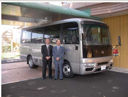
送迎用マイクロバス (左は上原専務理事、右は関根副理事長)