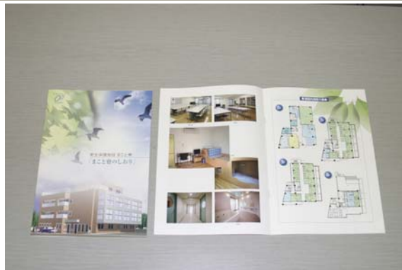
落成式を無事終えた「まこと寮」（新しおりより）

3. 状 況 昭和 39 年 3 月、更生保護施設「まこと寮」が社会復帰の第一歩を助けるための更生保護施設として、受け入れ収容保護事業を開始して以来、施設の老朽化が著しかったため、平成 18 年 10 月、全面改築に着工していましたが、平成 19 年 6 月 17 日、無事落成式を迎えたことを一つの区切りとして感謝状の贈呈がなされたものです。