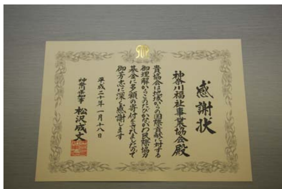
写真右下：かながわ国際交流財団感謝状