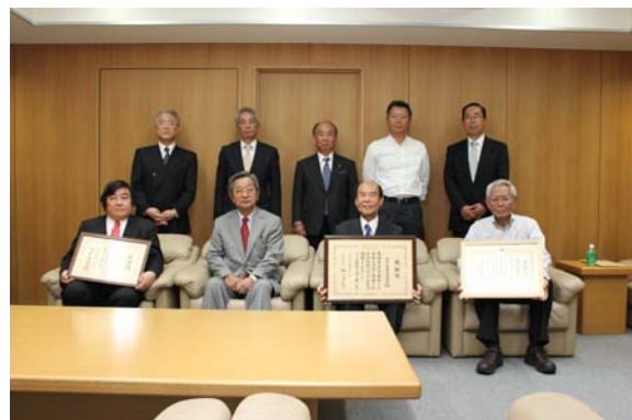
神奈川県遊技場協同組合・神奈川県福祉事業協会