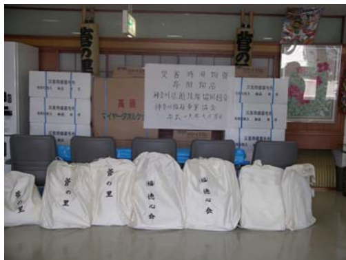
寄贈した防災用具一式