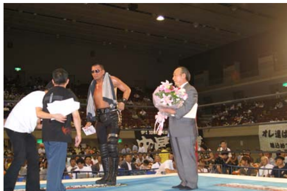
試合当日、リング上で花束と感謝状をいただきました。