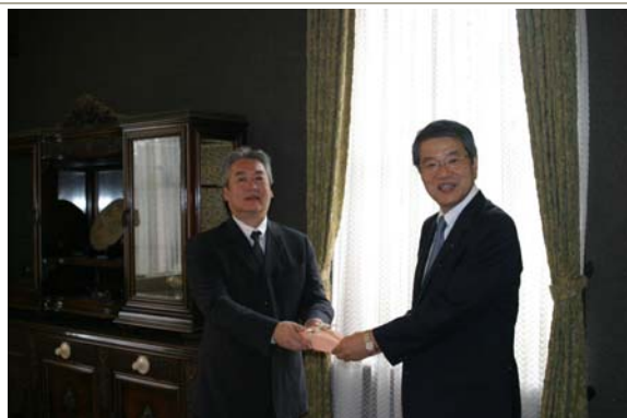
県への贈呈の様様